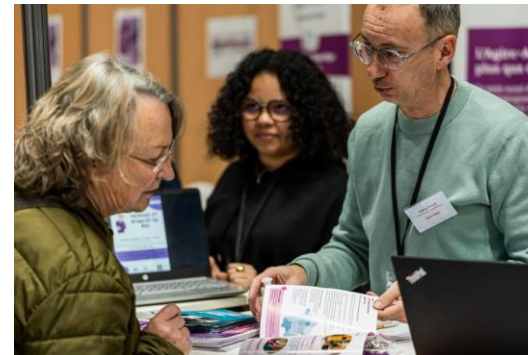
L'ESPACE CONSEIL RETRAITE