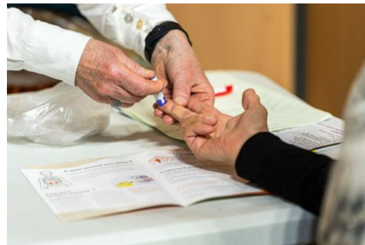
L'ESPACE DE DEPISTAGES