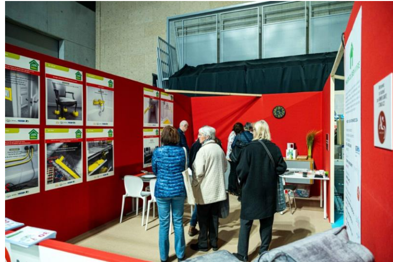
LA MAISON DU BIEN VIVRE