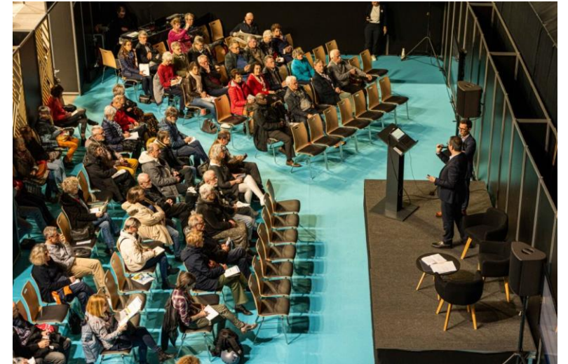
LES CONFERENCES, ATELIERS ET ANIMATIONS