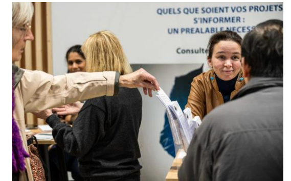
LES CONSULTATIONS JURIDIQUES